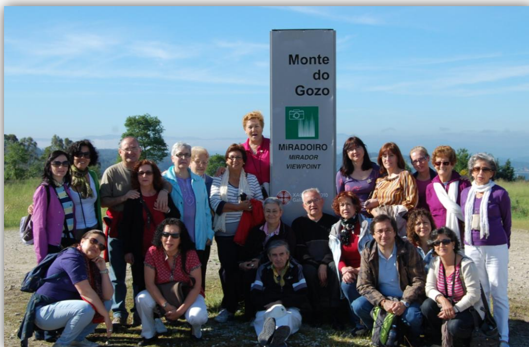
Haciendo el Camino de Santiago con la lectura de "El peregrino" de Jesús Torbado