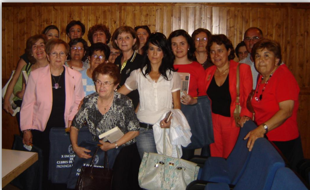
Encuentros con autores. Castillo de Bayuela.