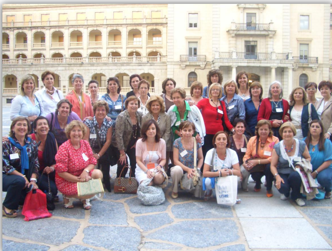
Club de Lectura de Borox

Si tuviésemos que animar a algún compañero a la creación de un grupo de lectura le diríamos que estimamos firmemente nuestra dedicación, que merece la pena el esfuerzo que va a llevar a cabo, porque es un esfuerzo que repercute muy positivamente en nosotros mismos.