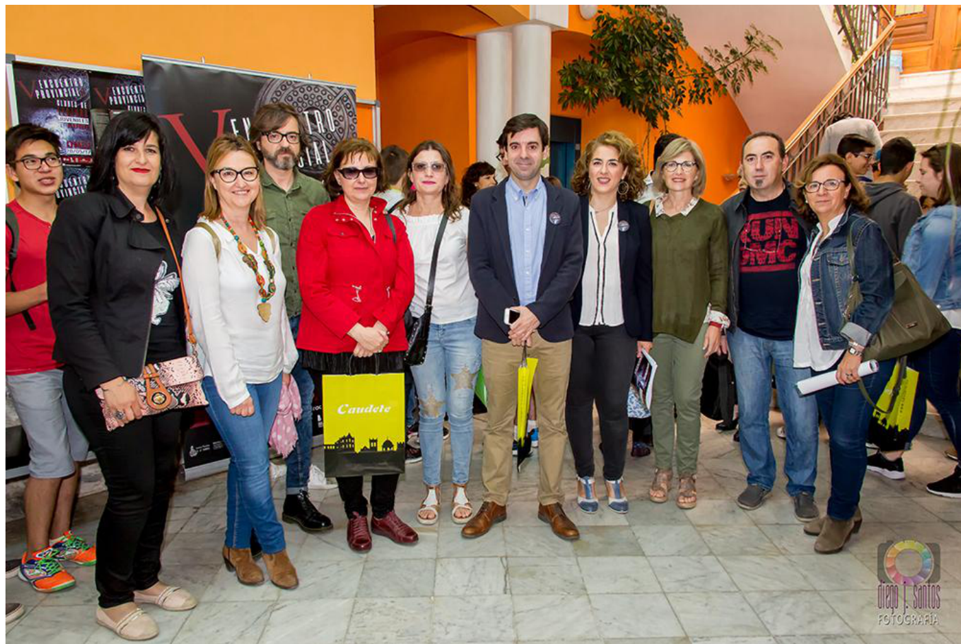
MONITORES DE CLUBES DE LECTURA. ORGANIZACIÓN DAVID LOZANO